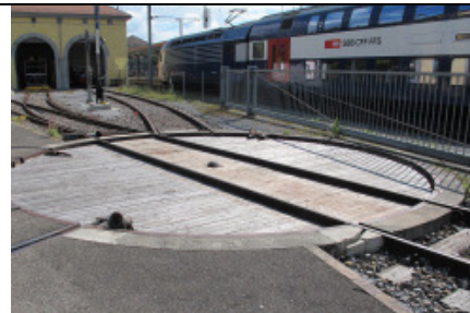
Die Weichen werden gestellt