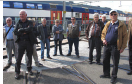
VASO-Mitglieder lassen sich informieren