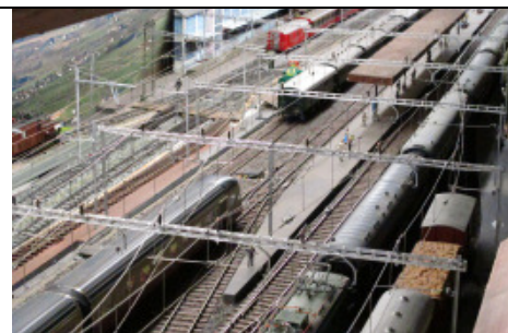
Betrieb bei der Modelleisenbahn