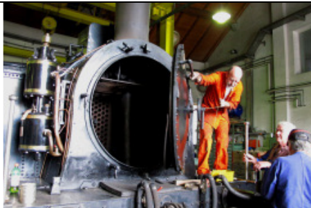
Eine Dampflok in Revision